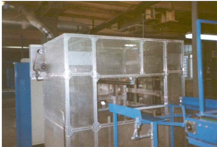
Platen isolatiemateriaal accumulatie en transport