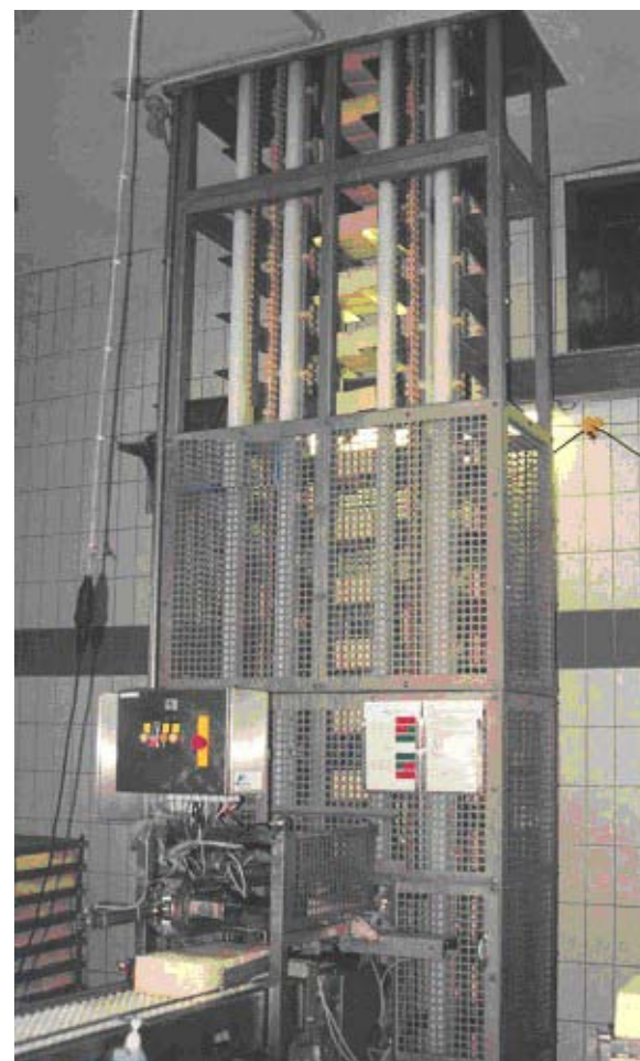
Discontinulift voor kazen

De rubberblokketting zorgt voor een zeer geluidsarme loop. Hierdoor zullen naastgelegen werkruimtes geen hinder ondervinden van de liften. Omdat regelmatige smering, afstellen en het opnieuw spannen niet nodig zijn worden de onderhoudskosten tot een minimum beperkt. De kwaliteit van de ketting wordt bepaald a.d.h.v. de toepassing. Over het algemeen worden de kwaliteiten SBR, welke zeer slijtvast is, en Neopreen, die oliebestendig is, toegepast. Door de ingeweven staalkabels heeft de rubberblokketting een zeer hoge trekkracht. Speciaal voor de zwaardere liften heeft Internovi/Nerak een rubberblokketting type 55/100 ontwikkeld, dit is een combinatie van alle goede eigenschappen van alle INTERNOVI / NERAK rubberblokkettingen.