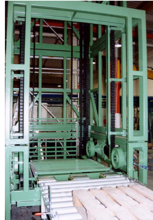
Uitvoering voor Euro-pallets